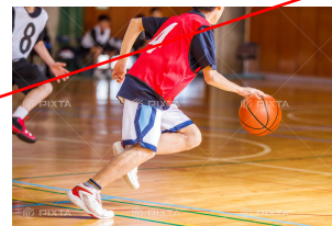
コンプレッション系のウェアではない