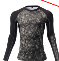
模様がある。単色ではない。