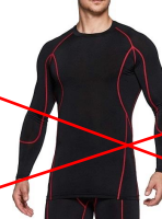
ラインに同系色では無い色がついてる